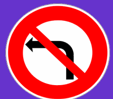
Panneau Interdiction de tourner