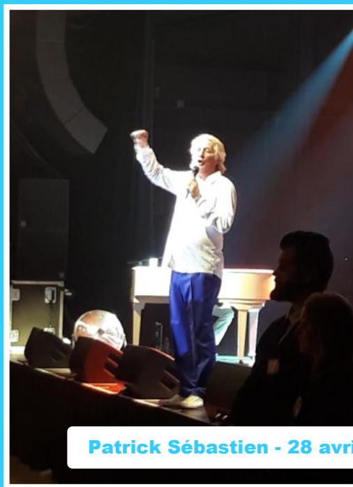
Patrick Sébastien - 28 avril 2017