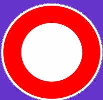
Panneau Interdiction de circuler sauf riverains

Rue Pablo Picasso : Entre l'entrée de l'établissement de l'ESAT-EA de Woincourt et la rue Garcia Lorca (lotissement Les solettes), un sens unique de circulation est instauré à partir de l'établissement de l'ESAT-EA vers la rue Garcia Lorca. Les véhicules susceptibles d'utiliser le sens opposé interdit, emprunteront l'itinéraire suivant : Rue Jean Jaurès et rue Clodomir Ducroq.