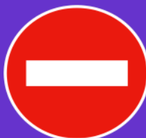
Panneau Sens interdit