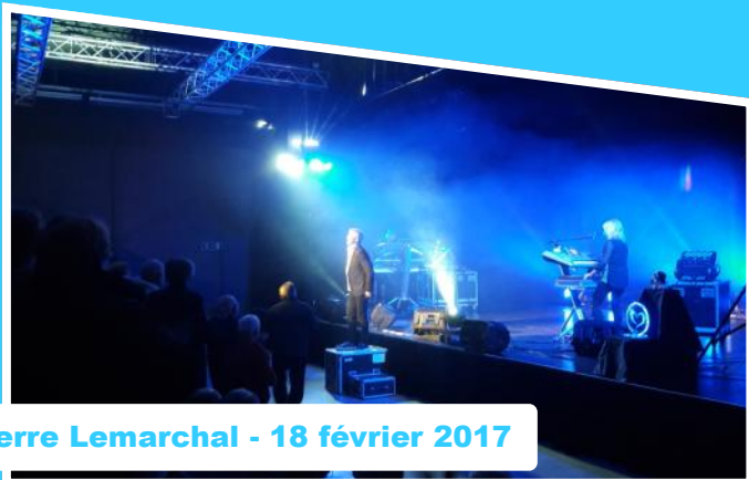
Pierre Lemarchal - 18 février 2017