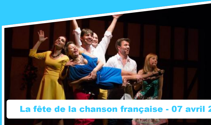
La fête de la chanson française - 07 avril 2017