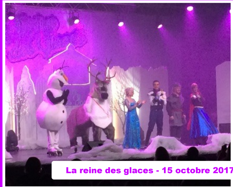
La reine des glaces - 15 octobre 2017