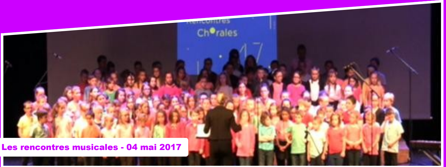
Les rencontres musicales - 04 mai 2017