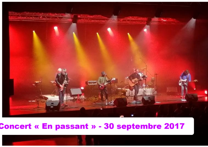
Concert « En passant » - 30 septembre 2017