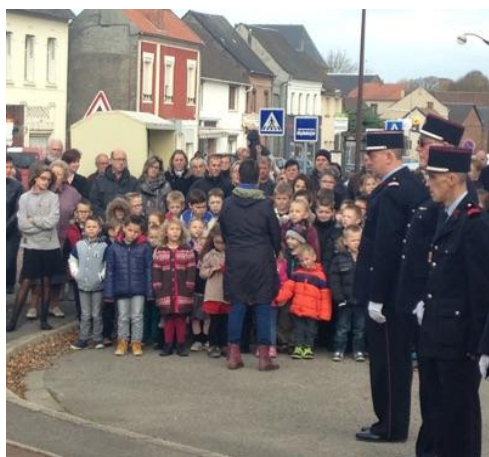
Les enfants de l'école élémentaire pour la Marseillaise