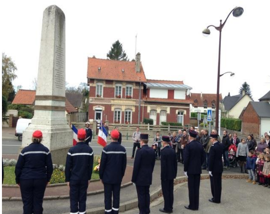
Recueillement devant le monument aux morts