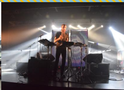
Picardie Mouv' 2015