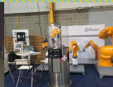
Les journées techniques