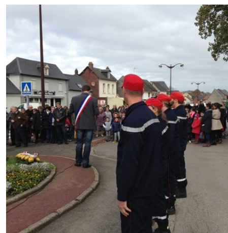
Discours de Monsieur le Maire