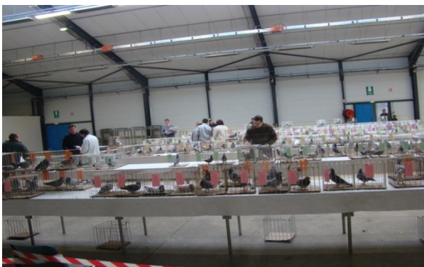
Vue d'ensemble de l'exposition

Le président a remercié tous les membres participants ainsi que Mr le MAIRE et le conseil municipal présent au vin d'honneur.