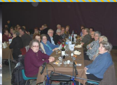
Le repas des aînés